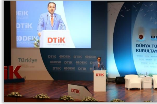
T.C. Başbakanlık Yurtdışı Türkler ve Akraba Topluluklar Başkanı Kudret Bülbül

T.C. Dışışleri Bakanlığı tarafından yürütölen ‘Memleketim’ projesini katılımcılara sunan T.C. Dışışleri Bakan Yardımcısı Naci Kuru’yu, T.C. Başbakanlık Yurtdışı Türkler ve Akraba Topluluklar Başkanı Kudret Bülbül takip etti. Başkan Bülbül, yurtdışında yaşıyan Türklere yönelik çalışmaları hakkında bilgi verdi.