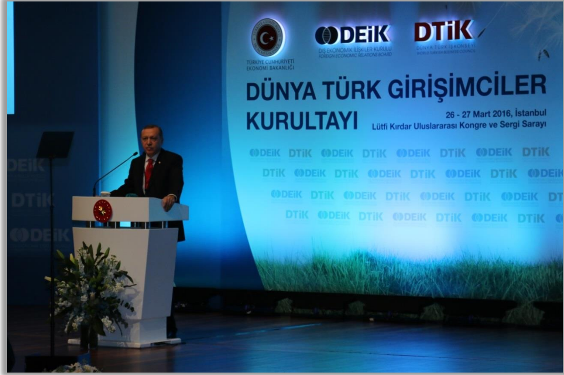
T.C. Cumhurbaşkanı Recep Tayyip Erdoğan

Açış konuşmasında T.C. Cumhurbaşkanı Recep Tayyip Erdoğan, büyük bir güç ve potansiyele sahip olan Türk işadamlarının dünyada çok geniş bir coğrafyaya yayıldığını vurguladı. Kazancının, ekmeğinin peşinde olan iş adamlarını Çağdaş Alperenlere benzeten Cumhurbaşkanı, insanların vatanlarını terkmesi altındaki en temel sebebin ekonomik gerekçeler olduğunu söyledi ve Suriye ile Irak krizleri sebebiyle Türkiye'nin 3 milyon üzerinde sığınmacıya ev sahipliği yaptığını ifade etti. Son 13 yılda yurtdışında Türk müteşebbislerinin sayısının önemli oranda arttığına dikkat çeken Cumhurbaşkanı, 19'u yoğun olmak üzere Türklerin dünyanın 167 ülkesinde var olduğunu, Türklerin milli ve manevi değerlerinden asla vazgeçmemeleri gerektiğine vurgu yaptı.