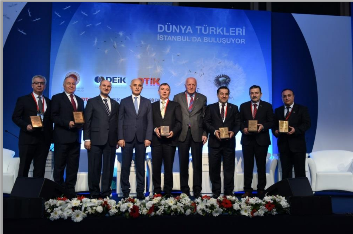
DTİK 2011-2016 Bölge Komite Başkanları