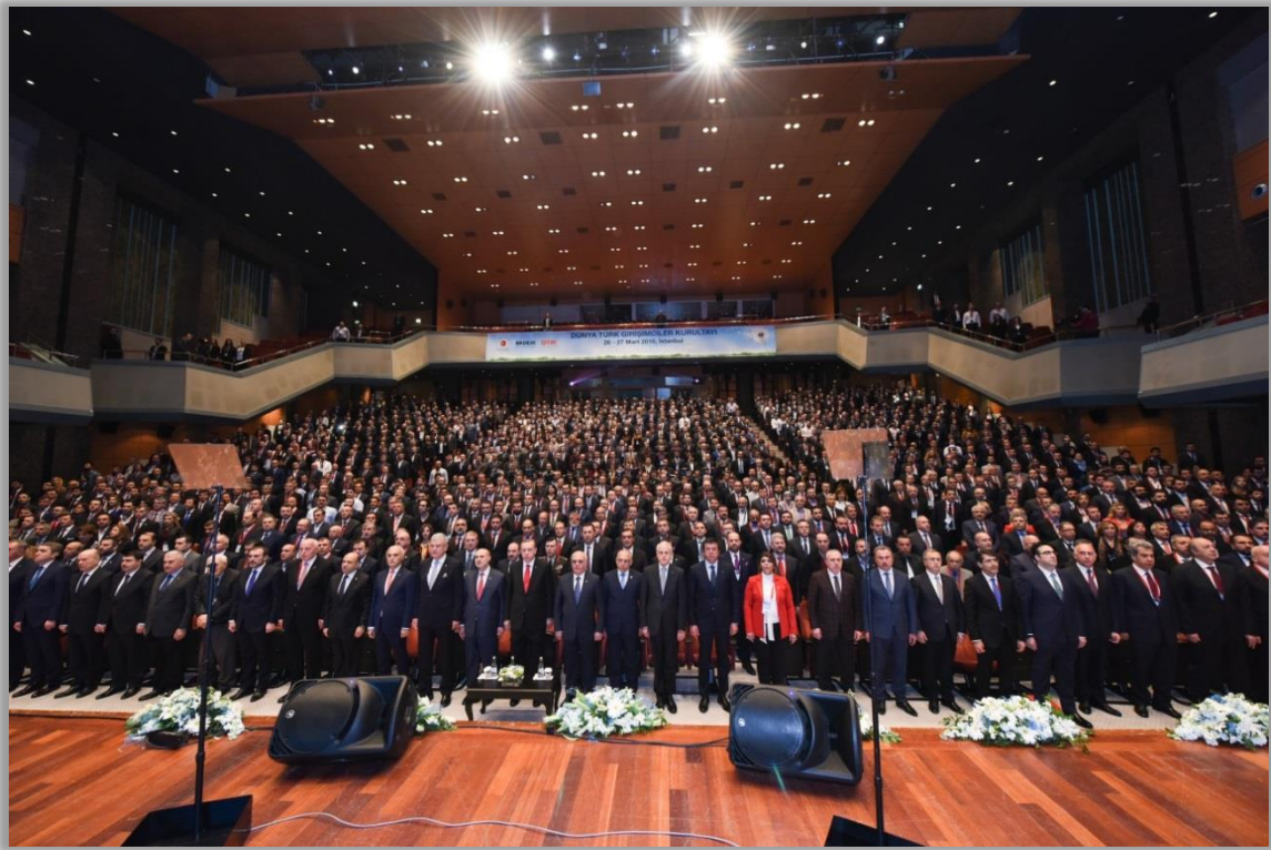
Dünya Türk GiriŐimciler Kurultayı'nın AçıŐ Töreni

T.C. Ekonomi Bakanlığı ve DıŐ Ekonomik İliŐkiler Kurulu (DEİK) ev sahipliğinde, Dünya Türk İŐ KONSEYİ çatısı altında gerçekteŐirilen Dünya Türk GiriŐimciler Kurultayı, 6 kitadan 2.000'e yakın Türk giriŐimcisi, profesyonel, akademisyen, dernek, vakıf ve benzeri iŐ dünyası örgütü temsilcilerinin bir araya getirdi. T.C. Cumhurbaşkanı Sayın Recep Tayyip Erdoğan ve T.C. BaŐbakan Sayın Ahmet Davutođlu'nun teŐrifleri ile onurlandırdıđı Dünya Türk GiriŐimciler Kurultayı, 26-27 Mart 2016 tarihinde İstanbul Lütfi Kırdar Kongre ve Sergi Sarayı'nda gerçekteŐirildi.