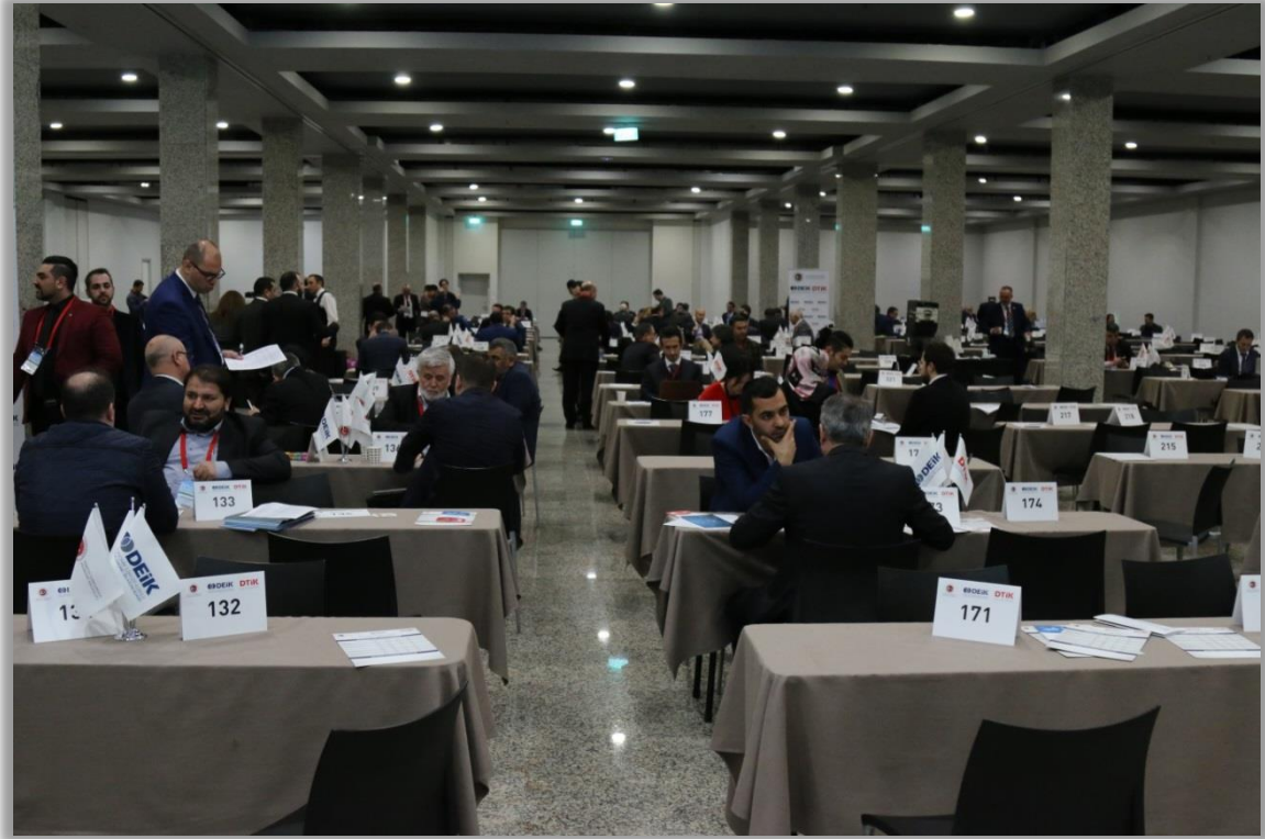
İkili İŐ GörüŐmeleri