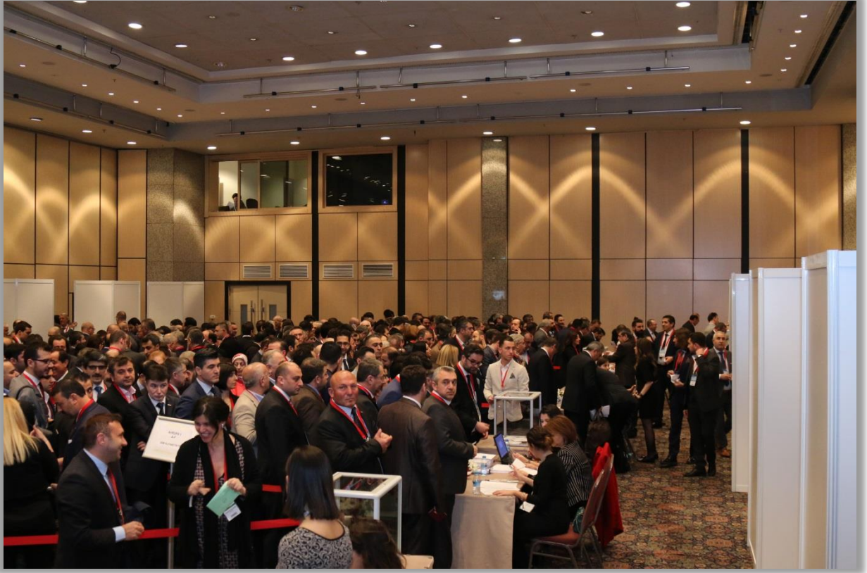
DTİK Genel Kurul Seçimleri

DTİK'in faaliyetlerinin dünya çapında temsili için bölgesel temsilcilerin belirlendiđi Genel Kurul seçimleri sonucunda, Afrika-Orta Dođu-Körfez, Amerika, Asya Pasifik, Avrasya, Avrupa, Balkanlar olmak üzere 6 Bölge Komitesi üyeleri belirlendi. Seçimler akabinde yeni seçilen Komite Üyeleri, kendi aralarında ilk toplantılarını gerçekleştirirken, Başkan ve Başkan Yardımcıları da seçildi.