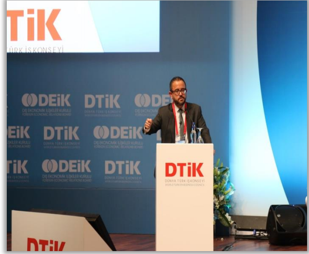
Pegasus Yönetim Kurulu Başkanı Ali Sabancı

Turkcell Yönetim Kurulu Başkanı Ahmet Akça ve Pegasus Yönetim Kurulu Başkanı Ali Sabancı, hedef kitlesi yurtdışında yaşayan Türkleri kapsayan çalışmalara imza atan, Turkcell ve Pegasus ile ilgili katılımcıları bilgilendirdiler.