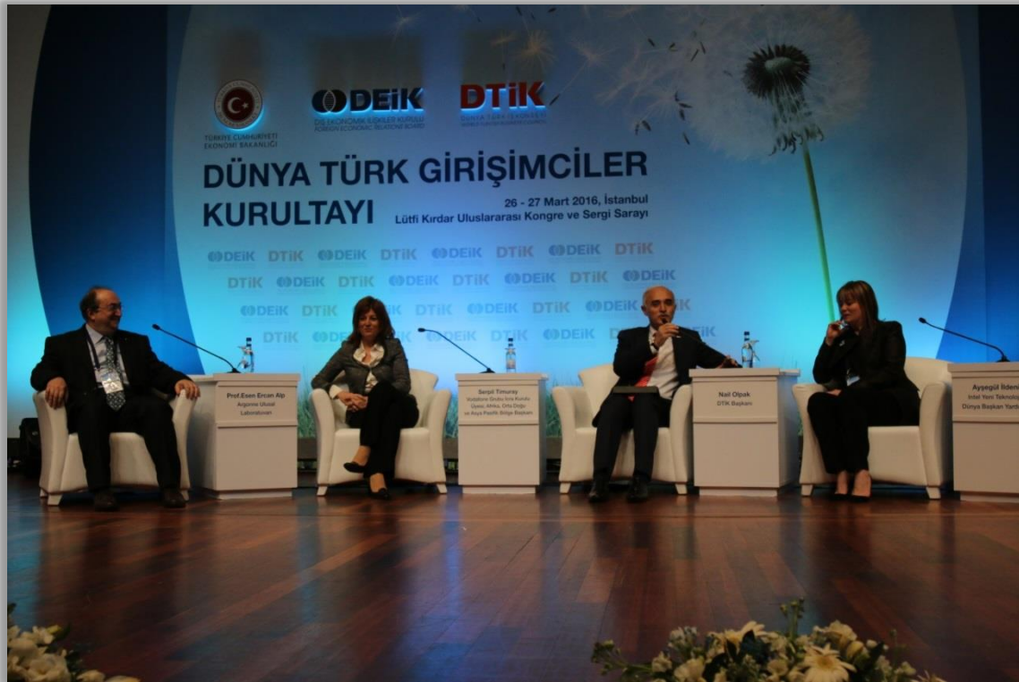
Dünya Türk Giriőimciler Kurultayı'nda gerçekleştirilen Profesyoneller Oturumu